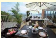
HOTEL万葉岬 瀬戸内絶景テラスBBQ

ご集合時間: 9時30分 集合場所: ヤマハ藤田オークマリナ オークマリナ(10:00) 〇〇播磨灘沿岸地域 (マリンレジャー体験など) 海の駅あいおい白龍城... HOTEL万葉岬 瀬戸内自然の中でフィッシングやシーバスケットなどマリンアクティビティ (別料金) で、お楽しみください。 ※ (1) .....瀬戸内絶景テラスBBQ 〇〇瀬戸内・家島諸島クルーズ体験 〇〇オークマリナ (15:00~15:30) 瀬戸内播磨灘を望む万葉岬に建つテラスで心地いい海の風と香りを 〇〇オークマリナ (15:00~15:30) 感じながら炭火焼バーベキューを楽しみます。 (海の駅あいおい白龍城より送迎有り) 食事 船: 昼: 〇 タ: 〇