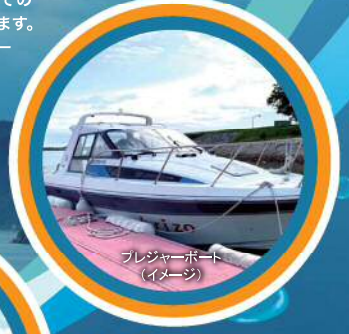
プレジャーボート (イメージ)