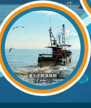
底引き網漁体験 (イメージ)