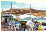
魚介類でバーベキュー (イメージ) (アイランドハウスいえしま荘)

ご集合時間: 9時30分 集合場所: ヤマハ藤田オークマリナ オークマリナ(10:00) 〇〇家島諸島沖(底引き網漁体験) 〇〇家島真浦港 ..... 家島諸島沖合いの漁場で底引き網漁を見学体験します。 .....アイランドハウスいえしま荘 〇〇瀬戸内・家島諸島クルーズ体験 〇〇オークマリナ (15:00~15:30) 家島の小高い山の上で、瀬戸内家島諸島の 〇〇オークマリナ (15:00~15:30) 抜群の眺望を眺めながらのバーベキューの昼食 ※ (3) 食事 船: 昼: 〇 タ: 〇