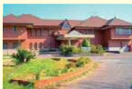
アイランドハウスいえしま荘

ご集合時間: 9時30分 集合場所: ヤマハ藤田オークマリナ オークマリナ(10:00) 〇〇家島B&G海洋センターマリン体験 ..... 家島の自然の中でカヌーやSUP、ウィンドサーフィン、シュノーケリング、フィッシングなど、海あそびをお楽しみください。 ※ (1)(2) .....アイランドハウスいえしま荘 〇〇瀬戸内・家島諸島クルーズ体験 〇〇オークマリナ (15:00~15:30) 家島の小高い山の上で、瀬戸内家島諸島の 〇〇オークマリナ (15:00~15:30) 抜群の眺望を眺めながらのバーベキューの昼食 ※ (3) 食事 船: 昼: 〇 タ: 〇