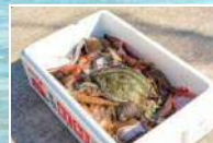
底引き網漁体験漁獲イメージ