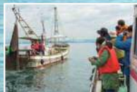
底引き網漁体験 見学

ご集合時間: 9時30分 集合場所: 姫路港ポートセンタービル 姫路港(9:40) 〇〇家島諸島沖 (底引き網漁体験) 〇〇家島真浦港 ..... 姫路港より雄観光の旅客チャーター船で家島諸島沖の漁場へ移動、底引き網漁船に合流後、底引き網漁を見学体験します。 ..... アイランドハウスいえしま荘 〇〇家島内自由散策 ..... 家島 〇〇(定期船) 〇〇姫路港 家島の小高い山の上で、瀬戸内家島諸島の 〇〇家島 〇〇(定期船) 〇〇姫路港 抜群の眺望を眺めながらのバーベキューの昼食 ※ (3) 復路、家島~姫路港は、(15:00~18:00頃) 共通乗船券でお好みの時間に乗船ください。 共通乗船券でお好みの時間に乗船ください。