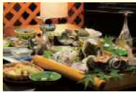
かわさき料理 (イメージ)

④~⑧ コース共通 募集人員 各日1組5~8名まで (5名以上でお申し込みください。) 最少催行人員 5名 添乗員 同行しませんが、現地係員がご案内します。 申込締切 出発日の7日前まで 参加資格 小学生以上 旅行代金小人は、小学生となります。 但し、定員になり次第締め切らせて頂きます。