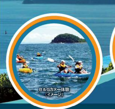
B&Gカヌー体験 (イメージ)